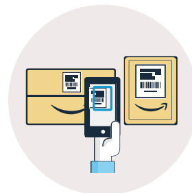
Scannez les colis remis au client

Pour devenir le point de retrait référent sur votre zone de chalandise, contactez-nous au 01 49 28 68 68 ou contact@groupe-nap.com