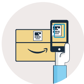
Scannez les colis réceptionnés